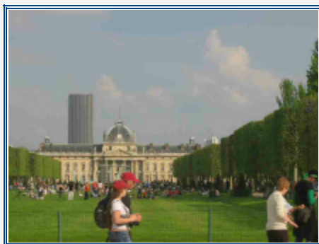
Entre Tour Eiffel, Ecole Militaire, Unesco et Montparnasse

Avec le soutien de l'Institut Paul Sivadon, Association l'Elan Retrouvé 23 rue de La Rochefoucauld, 75009 Paris